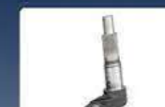
вал с шлици shaft with splene