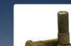
болт колесен bolt