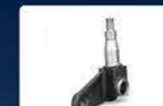
шенкел stab axle