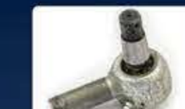
ябълковидни съединения ball and socket joint