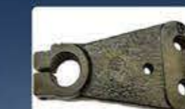
лост с шлицев отвор stotted lever