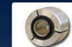
лагер сферичен еластичен bearing(sphere-elastic)