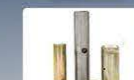
ос шенкелна knuckle axle